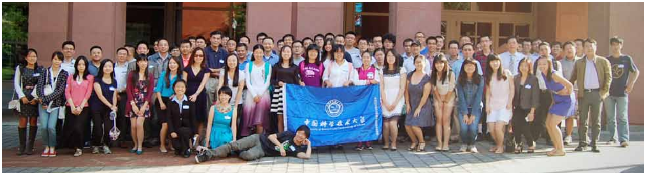
8月17日，大费城地区110余人校友出席聚会，为费城历年规模之最，业界校友人数之最。