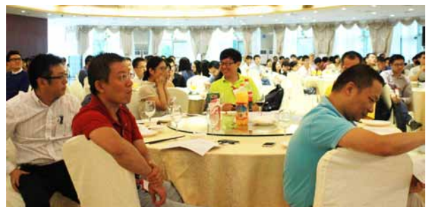
9月14日，168位校友出席上海校友烧尾宴。