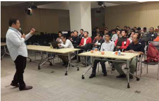
10月23日，以互联网思维颠覆传统行业的80后与准90后创业家在向北京校友分享创业经历。