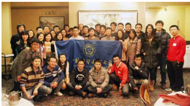
2月2日，50余位圣路易斯校友与亲属进行新春聚会，包饺子庆祝春节。