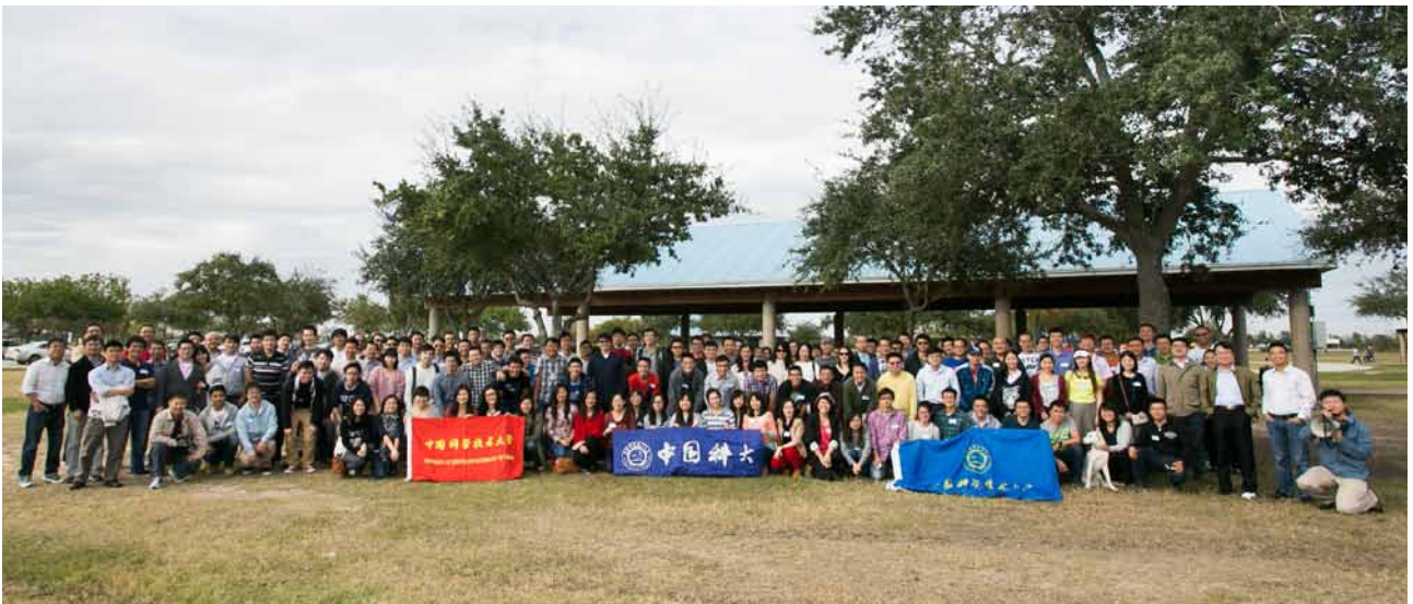
11月8日，休斯顿校友会举办秋季野餐会，共有160余名校友及家属参与。