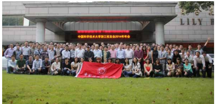
10月25日，浙江校友会年会举行，近150位在浙校友相聚一堂。