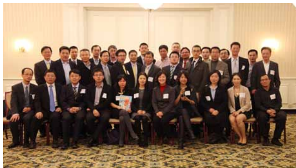
2月6日，华尔街校友群英会暨鸡尾酒会在纽约进行，35位金融界资深校友出席聚会。