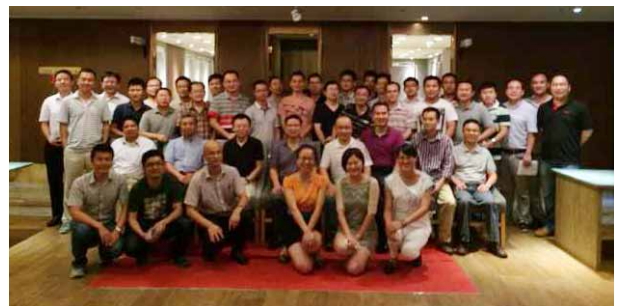
8月30日，近50位宁波校友初秋聚会，并倡议重建宁波校友会。