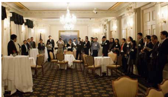
2月12日，金融界新春酒会在芝加哥进行，35位校友出席。