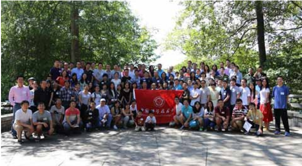
9月20日，亚特兰大百余名校友及家属交流聚餐，并亚特兰大校友会的成立。