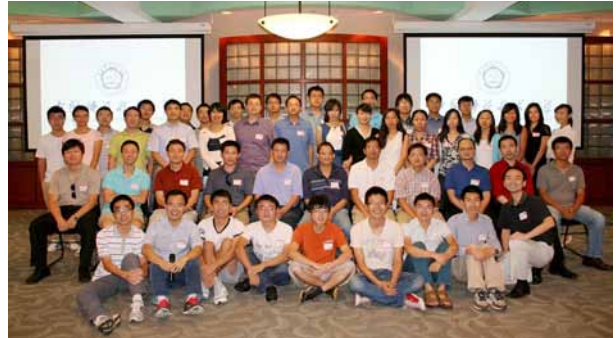
9月21日，第一届奥斯汀地区校友年会举办，50位校友参加创历年活动规模之最。