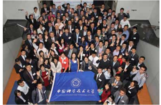
10月12日，中国科大纽约峰会在哥伦比亚大学商学院落幕，近300名各行业从业者和学生参与。