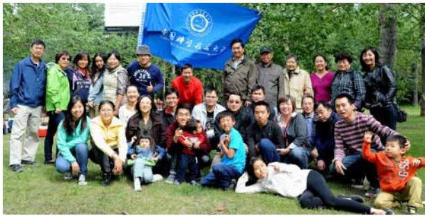
7月26日，卡尔加里校友进行聚会，15位校友出席。