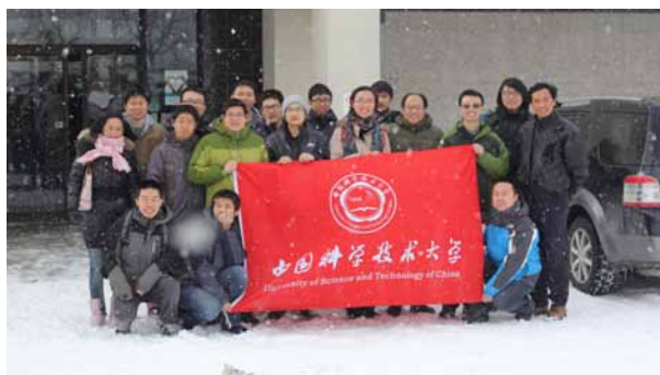
1月25号，加拿大滑铁卢大雪纷飞，18位校友相聚庆祝新春。