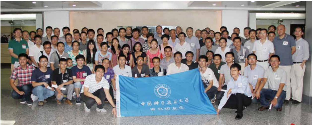
7月19日，青岛校友会新理事会启航，80位校友相聚，这是青岛校友最大规模聚会。