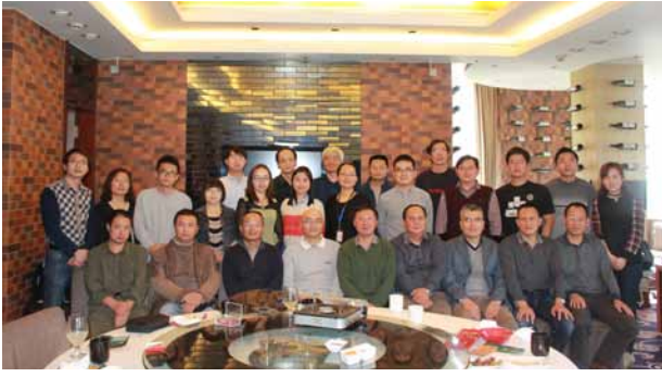
3月2日，26位校友出席昆明校友午餐会，并成立云南校友会。