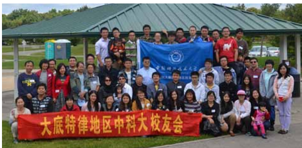
9月14日，大底特律地区校友（含温莎、安娜堡及兰辛）夏日野餐会举行，60余位校友、家属参加。