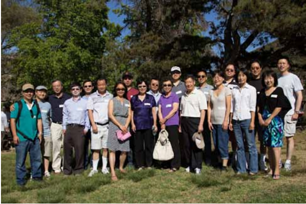
6月14日，圣地亚哥校友进行年年度野餐会，70多位校友参加。