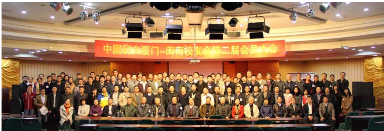
1月1日，厦门迎来闽南校友年会，这场140余人出席的年会也成为2014年中国科大全球第一场大规模聚会。

2014年，中国科大各校友组织（含新创基金会）在中国、美国等举办重大校友活动约40次，校友网络有效促进了地区与行业校友的沟通。以下摘录部分校友活动花絮：