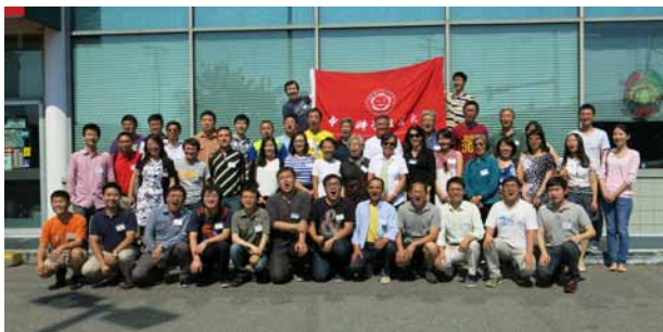
8月23日，中国科大加拿大卑诗校友会成立，48位校友出席。